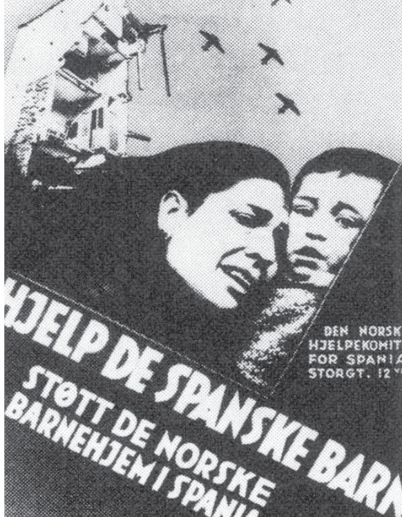
Bilde av plakat "hjelp de spanske barn"

Creditbank i Oslo. Med jevne mellomrom sendte de 110 lokale spaniakomiteene inn penger til denne kontoen. Fra komiteen i Haugesund ble de første innsamlede midler sendt til hovedstaden 5. desember 1936.