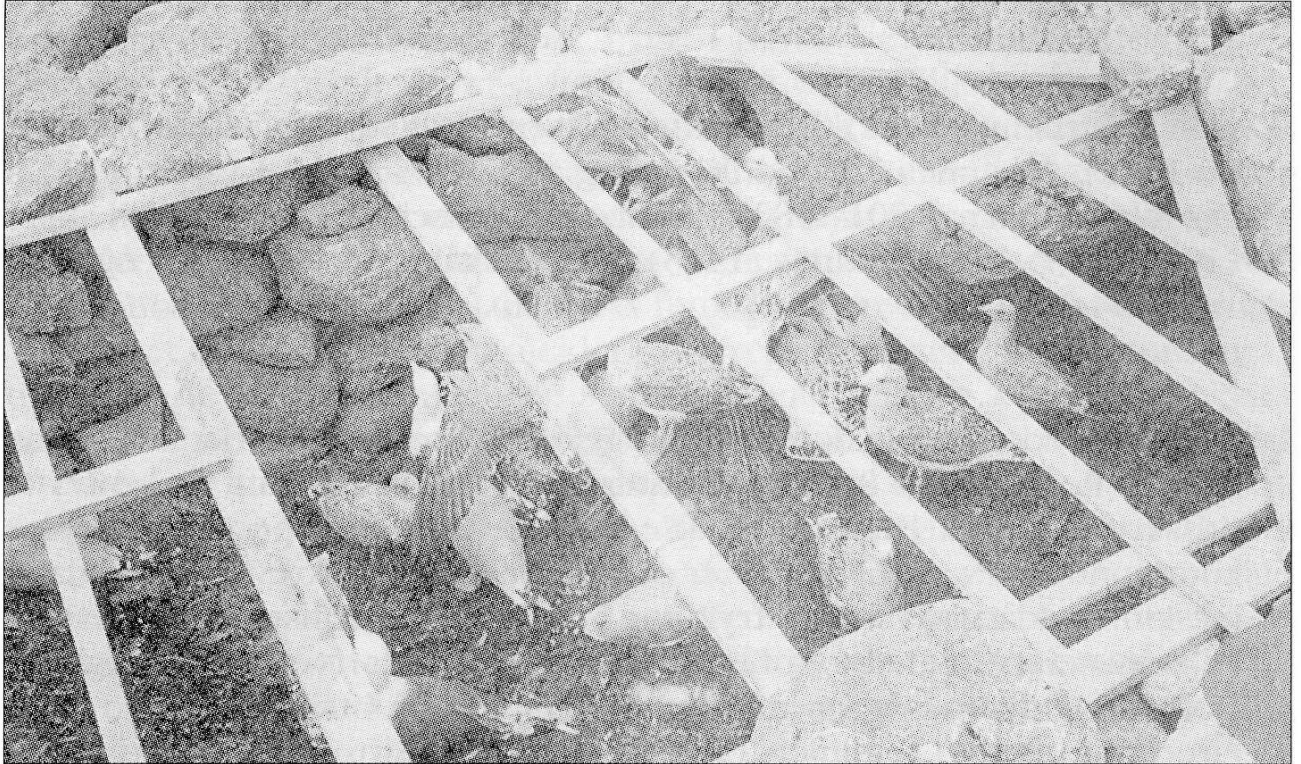
Fra kulturminnedagen 28. september 1997 hvor 24 måker ble fanget i måkehuset.