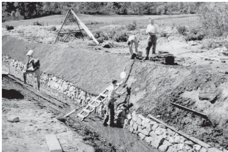
Bygging av Eikelandskanalen. Torvlegging på kantene av kanalen.

eit fint tiltak kameratane sette i gong, sjølv om det var krig og knapt med mat. Men dei hadde det visst moro. Det var visst hirsegrynsgrauten som var den gjevaste maten på kafeen, men dei kunne og få kjøpa andre ting, jamvel “blautkake”. Den fekk me frå Bore sitt bakeri nede i Vikedalsosen. Men det var sjølvsagt uråd for Bore å laga “blautkake” eller “fløytekake” på normal vis under krigen, så kaka var både låg og svart. Men eg trur me borna lika ho godt likevel, for eg kan enno “kjenna” smaken av kaka dersom eg konsentrerar meg godt. Brus selde me og på kafeen, og i samband med det må eg fortelja ei historie som er både fin og rørande.