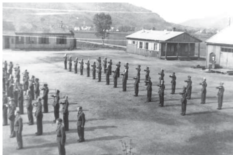
Eksersis med blanke spadar. Bak bjørka kan ein skimte bygningen med kaféen der forfattere vaks opp. Brakkene er frå venstre: matsalen, vaktbrakka med “fengsel” og litt av depotbrakka.