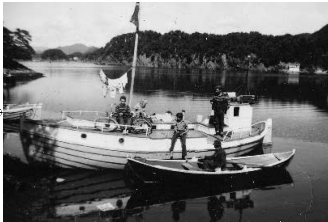
Båten var hjemmet for mange romanifamilier. Her har en familie ankret opp utenfor Nordstrøno, Os kommune i Hordaland. Båten som barna sitter i, ble kalt "Løvebåten".