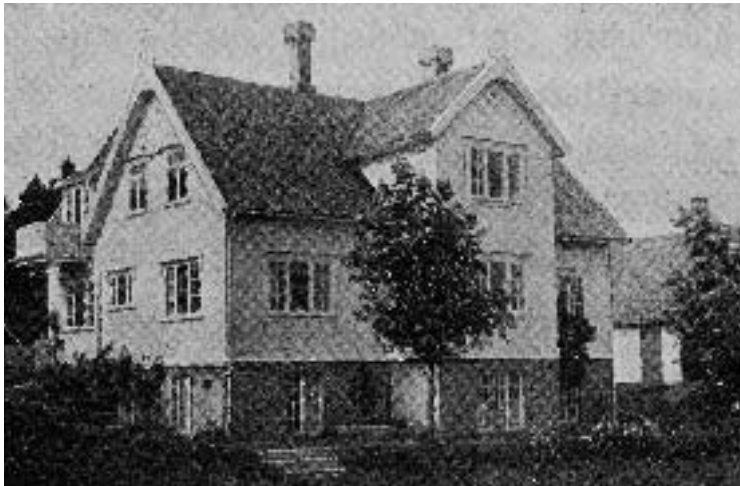
Jacob Walnums barnehjem i Kopervik var et av "Misjonens" seks barnehjem. Barnehjemmet ble opprettet for barn av romanifolket og målsettingen var å "ta" barna før de fikk smaken på reiselivet.

Mange ble sendt til Svanviken arbeidskoloni. En av informantene fortalte at familien ble sendt til Svanviken to ganger, og at de oppholdt seg der i til sammen sju år. Første gang de ble sendt dit var i 1959, og de skrev da under en kontrakt om at de måtte være der i fem år. Neste gang de ble sendt dit, skrev de under en kontrakt om å være der i to år. Trusselen om å bli fratatt barna hvis de brøt kontrakten, hang over dem. Dette oppholdet har satt sterke spor for resten av livet. En annen informant fortalte at hans familie var på Svanviken i tre år. Det bodde ca. ti familier der da. Mora stelte hus