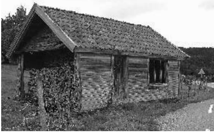
Dette huset i Nedstrand kalles "Villaen". Her bodde reisende familier om vinteren.