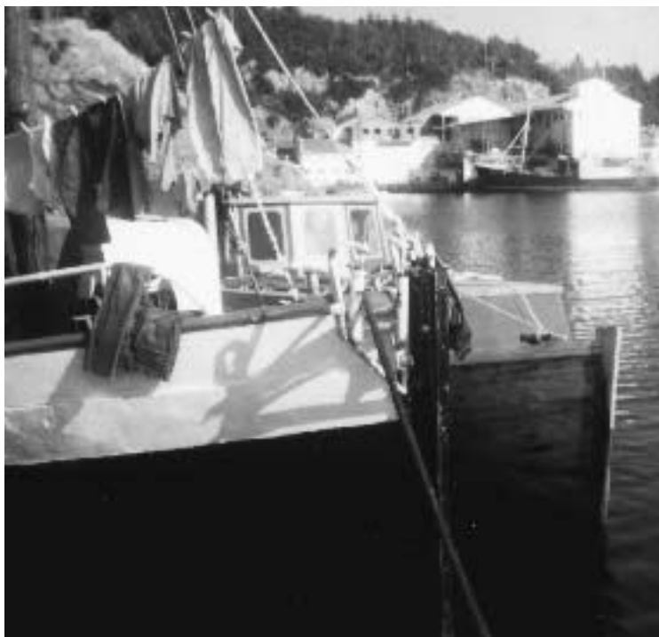
Øklandsvågen vest på Bømlo var et fast samlingssted for mange reisende familier som bodde i båt deler av året.

I noen familier preget det tradisjonelle kjønnsrollemønsteret arbeidsdelingen. Det var ofte mannen som gikk rundt på gårdene og bød fram varer eller håndverket sitt, mens kvinnene var igjen i båten og passet barn, vasket klær og laget mat. Men dette gjaldt ikke for alle: ”Mor mi gjekk på gardane og handla, hun lagde visper sjøl. Far min lagde takrenner – han gikk fra gard til gard og lagde de på stedet,” forteller en informant. En annen informant forteller også at han gikk sammen med moren og søsknene og solgte blikkvarer.