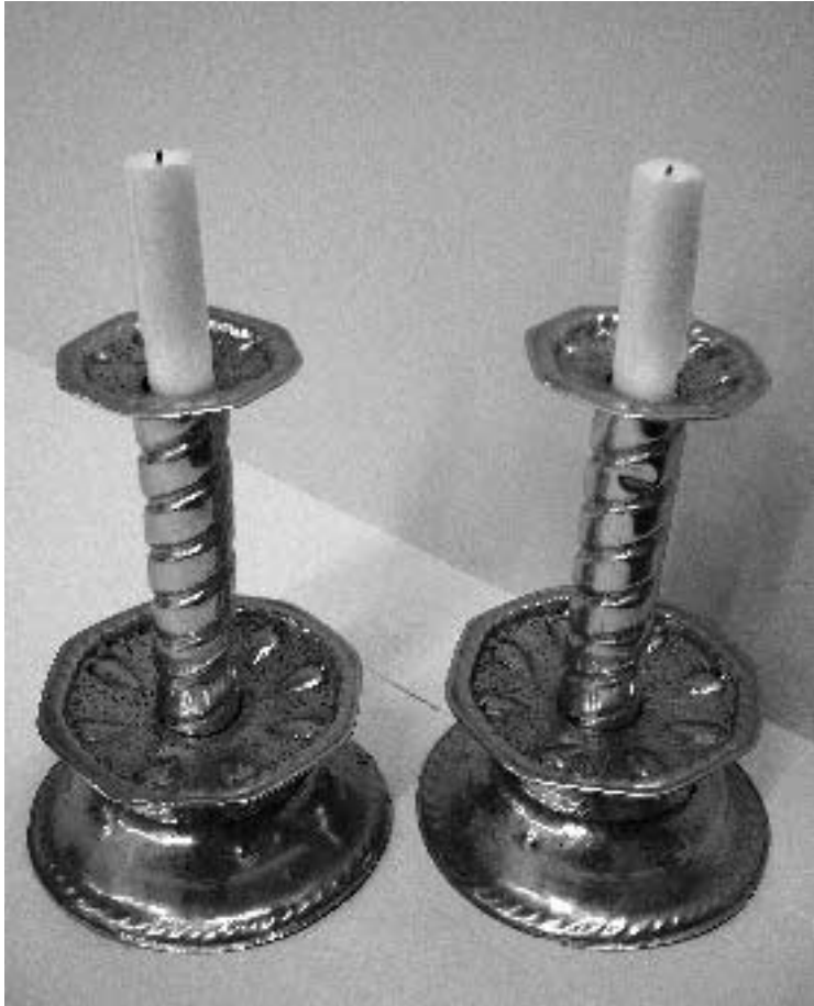
Messingstakene er laget av reisende som slo seg ned i Haugesund. Stakene finnes i mange hjem i Haugesund og distriktet.

bøtter og siler og leverte til Berstad/Wallendahl i Bergen etter krigen. Etter andre verdenskrig var det stor etterspørsel etter ”blekktøy” og flere reisende leverte til dem og til forretninger i Stavanger. Seinere begynte han å lage takrenner, og informanten forteller at han ennå har blikkenslagerverktøyet etter faren, ste, klubbe og loddebolt. Informanten lærte håndverket av faren sin og arbeidet sammen med ham i perioder. I 1960-åra hadde de jobber flere steder i Hordaland og Rogaland. I 1968 lå de i Kopervik i to måneder og laget takrenner. Faren var kjent og hadde et godt rykte, så de fikk mange jobber. I Hordaland og