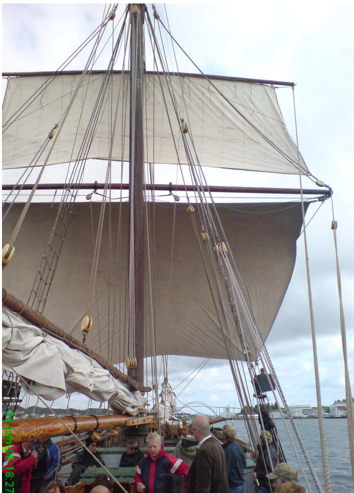
”Kaia” på havnatur juni 2008.

Nytt av året var havnaturer med Stiftelsen Haugesjøen hver torsdag gjennom sommeren. Turene gikk rundt Risøya og som regel en liten tur nordover forbi Vibrandsøy før retur. Alle gjestene fikk anledning til å se seg omkring nede i båtene og interesserte gjester fikk informasjon om den historiske bakgrunnen for skutene. Det var til sammen 115 besøkende på de 12 turene.