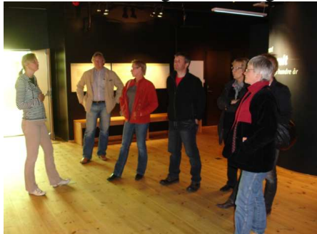
Ansatte på studietur til Romani-utstillingen på Elverum

De ansatte har økt sin museale kompetanse gjennom å arrangere og delta på nettverksmøter, seminar og kurs i 2008. De ansatte har også bidratt med foredrag i flere sammenhenger lokalt og sentralt.