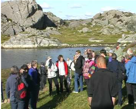
Museumstafetten fra Røyvær til Vikedal